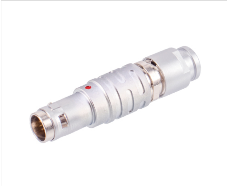
■ 电缆线夹和带护套型的尾盖